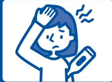
発熱のある方の 入場はご遠慮願います

受診前の発熱や体調不良により受診者として不適切と判断した場合は、受診をお断りする場合がございます。ご了承ください。