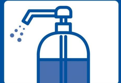
入場の際は 消毒をお願いします

受診当日は不特定多数の方が集まります。皆様安心して受診していただくためにも、出入りする際は手指消毒をお願いいたします。