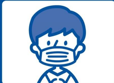
マスクを着用 しましょう

組合にて来所時間を指定させていただきます。皆様指定された時間に来所することで待機時間が少なく、受診へのご案内がスムーズになります。来所時間の徹底をお願いいたします。