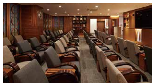
男性ドックフロア