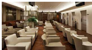
女性ドックフロア