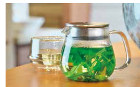
フレッシュハーブティー