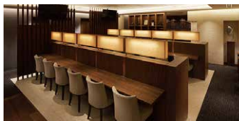
人間ドックラウンジ